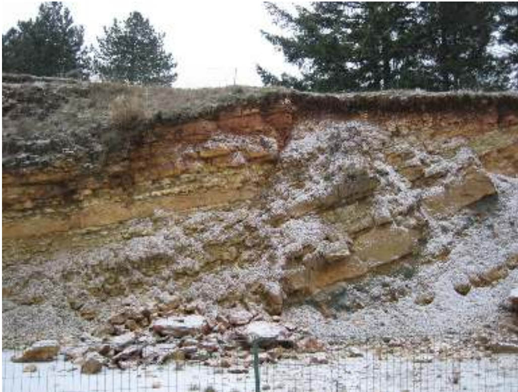
Les deux failles côté Sud

Dans le cas de l’affleurement Sud, l’expansion terrestre s’est exprimée en deux failles normales (on peut invoquer le caractère moins malléable de la structure de ce côté), avec des rejets de 1 m et 50 cm. On remarque une stratification régulière calcaire : une couche en gros blocs, puis une autre en petits blocs