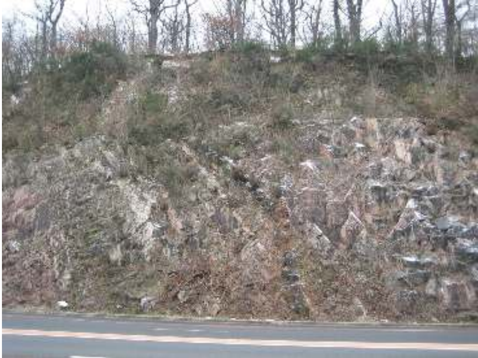
Photographie de l'affleurement granitique de Civrieux d'Azergue