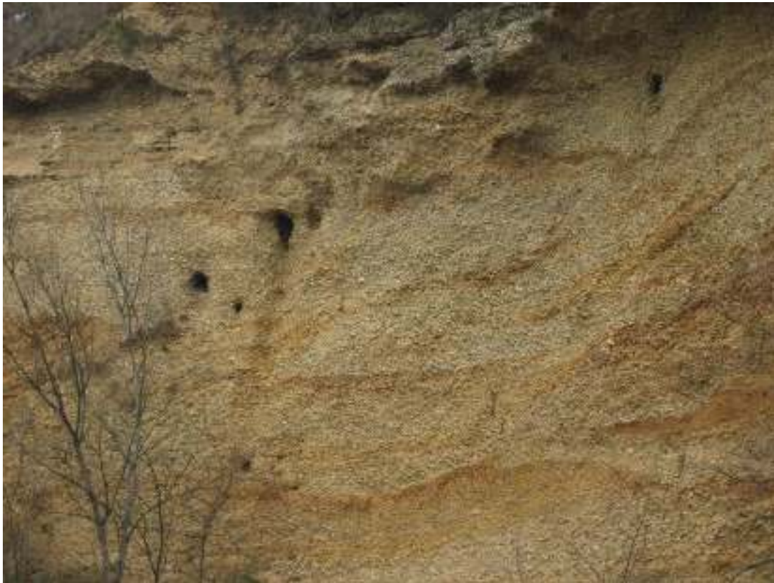
Affleurement de roches sédimentaires de Sathonay camp

On remarque plusieurs séries granoclassées de sédiments et galets. Cette superposition est due à la variation du lit du fleuve.