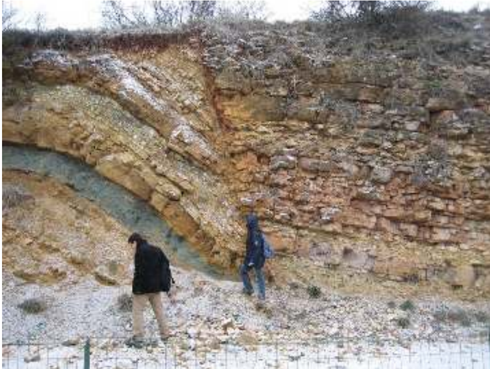
Affleurement côté Nord

Deux affleurements se font face. L'affleurement Nord présente une faille (caractère d'une zone d'extension) très marquée avec un plissement et un rejet de plus de deux mètres.