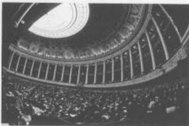
Vue de l'Assemblée nationale, à Paris, le 13 juillet 2012

9 décembre 2012 à 14:01 (9h à part) 10 décembre 2012 à 18:13