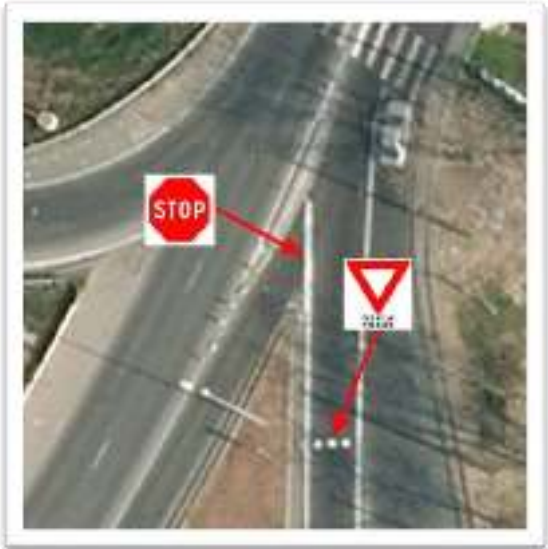
Figure 3 : Zoom sur la zone en vue aérienne