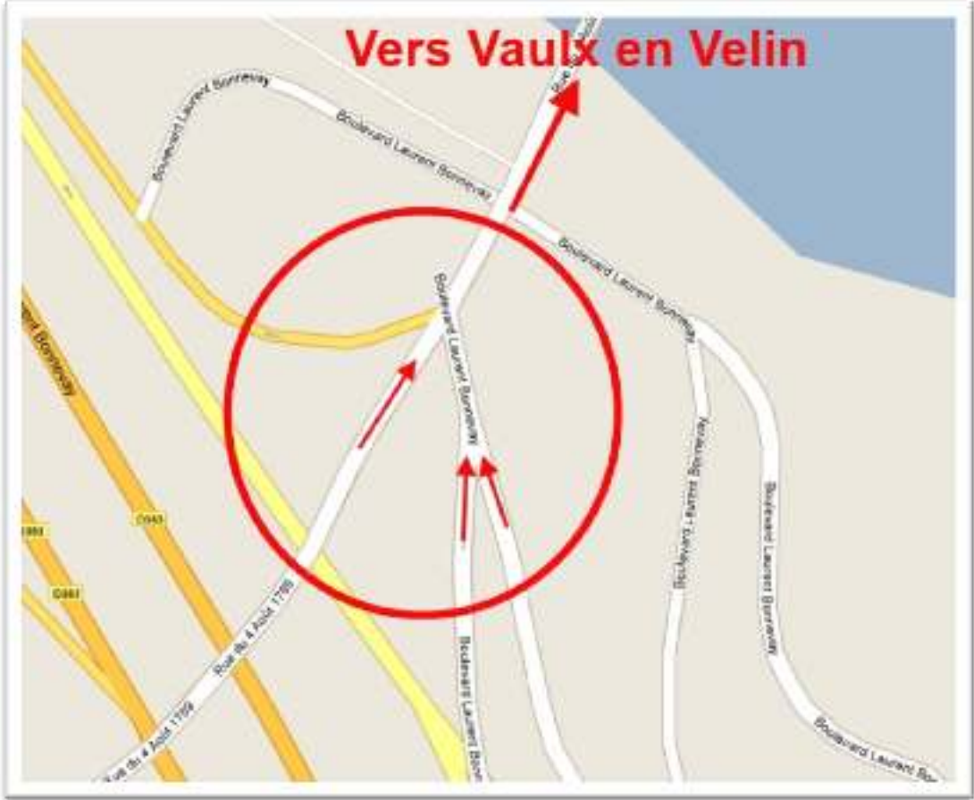
Figure 1 : Plan de la zone d'étude

La zone que nous avons choisie d'étudier se situe à Villeurbanne, à la jonction entre la rue du 4 août 1789 et le boulevard Laurent Bonnevey. Il s'agit d'un carrefour impliquant trois voies (une sur la rue du 4 août 1789 et deux sur le boulevard Laurent Bonnevey). Les usagers qui circulent sur ces voies se dirigent vers le pont des Planches qui mène à Vaulx en Velin.