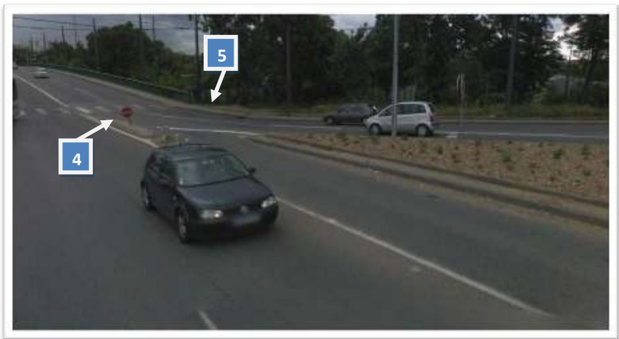
Figure 5 : Appréciation de l'angle de vision pour les usagers arrivant au STOP