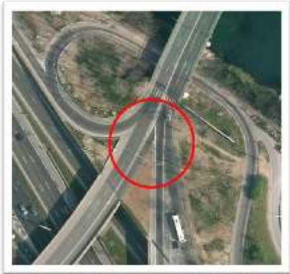
Figure 2 : La zone en vue aérienne