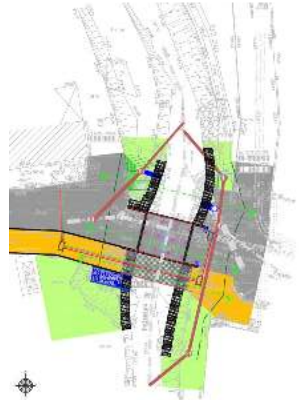
DCE du pont de la rue de la Sonde à Veauche